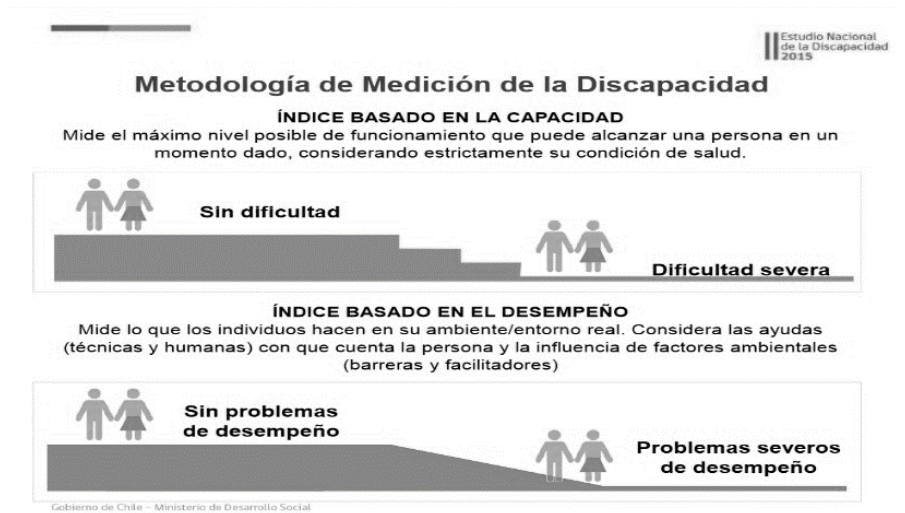
Figura 1. Discapacidad en Chile.

El Ministerio de Desarrollo Social, en el Estudio Nacional de la Discapacidad 2015, da cuenta de la metodología para medición de la discapacidad, Figura 1.