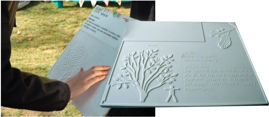
Figura 2. Placas gráfico-táctiles del Parque Inés de Suárez.

la naturaleza. La ausencia de color, en este caso, deja desnuda su estructura, permitiéndonos disfrutar a todos, de sus sinuosidades, así como de sus llenos y vacíos, y de este modo modelar su existencia en nuestra imaginación.