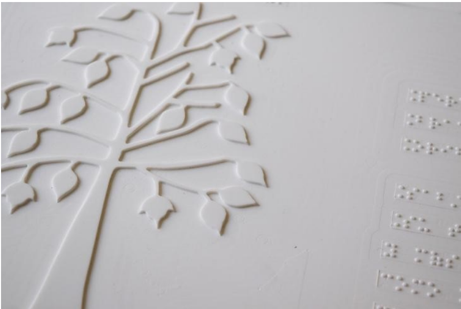
Figura 1. Imagen táctil.

De este modo la persona ciega al habitar un espacio desconocido, experimenta constantemente la sensación de vacío en lo que se le presenta, más allá de la extensión de sus brazos o el alcance de su bastón. Este gran vacío sin embargo está colmado de otras sensaciones distantes, como los sonidos y los aromas, los cuales pueden ser rearticulados en un espacio que adquiere formas, al tallarse la materia, en este caso el krión, generando figuras en relieve que le permiten completar la escena en su imaginario.