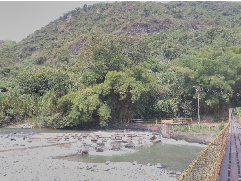
Fotografía 1. Río Guadalajara de Buga a la altura de la bocatoma (zona media)

Cabe aclarar que para este ejercicio se tendrán en cuenta los paisajes hídricos que atraviesan la ciudad de Buga, donde se reconocen tres divisiones geográficas asociadas a: la producción hídrica (zona alta); ganadería extensiva (zona media) y monocultivo de la caña de azúcar (zona plana). Así mismo, se abordarán las narrativas, representaciones, fronteras, redes y formas de poder de los diversos agentes quienes han limitado o posibilitado la gestión del agua a lo largo del tiempo, en aras de reconocer sus valoraciones del recurso y orientar procesos de planificación y gestión hídrica desde la apropiación social y sustentabilidad del recurso.